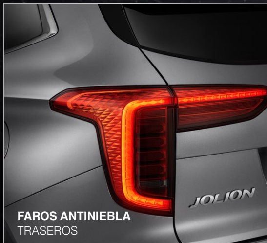
FAROS ANTINEBLA TRASEROS