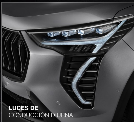
LUCES DE CONDUCCIÓN DIURNA